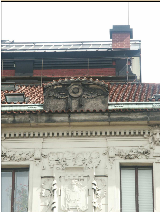
pohled na atiku západní fasády